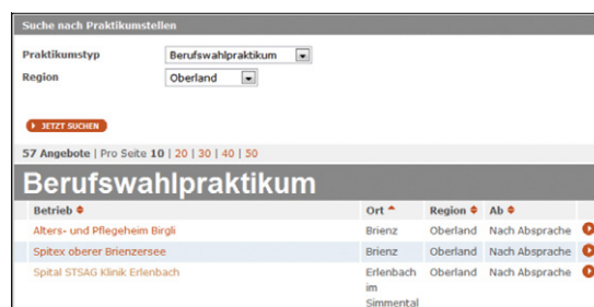
Abb. 1: Suchergebnis auf myoda

Einblickstage und verschiedene Arten von Praktika. Auf der andern Seite haben wir den Nachfrager, der ein bestimmtes Angebot sucht. Auf myoda.ch weiss der Nachfrager, nachdem er sich informiert hat, genau, welche Praktikumsart er möchte. Eine Suchfunktion genügt. Es gibt aber auch Vermittlungssysteme, wo das Zusammenpassen von Anbieter und Nachfrager hoch komplex ist und eine Unterstützung in Form eines so genannten Matchings benötigt wird, z. B. bei der Partnervermittlung.