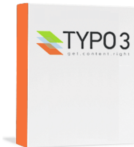
Das Open Source CMS Typo3